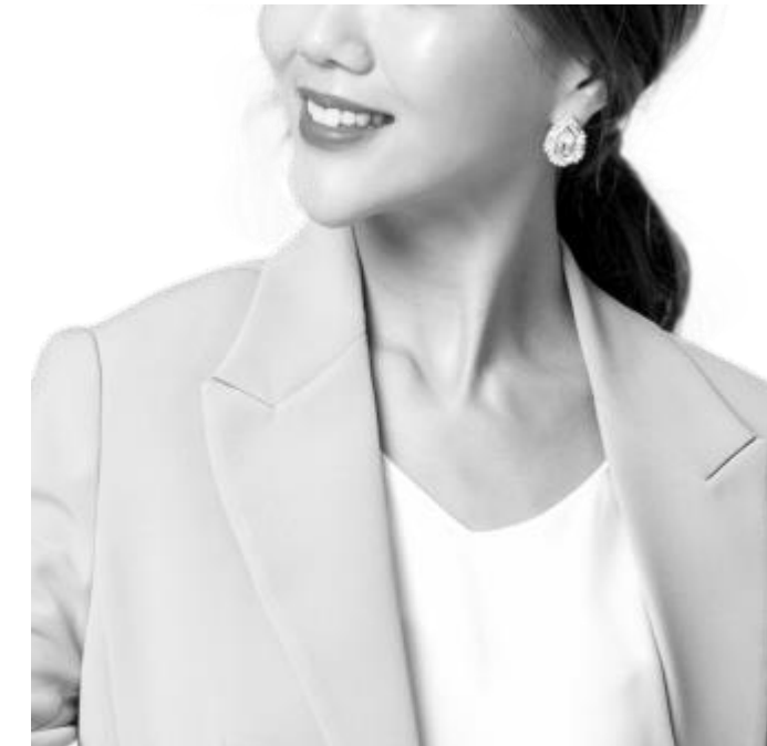
예쁜 선배, 창주친구들(남1,여1)