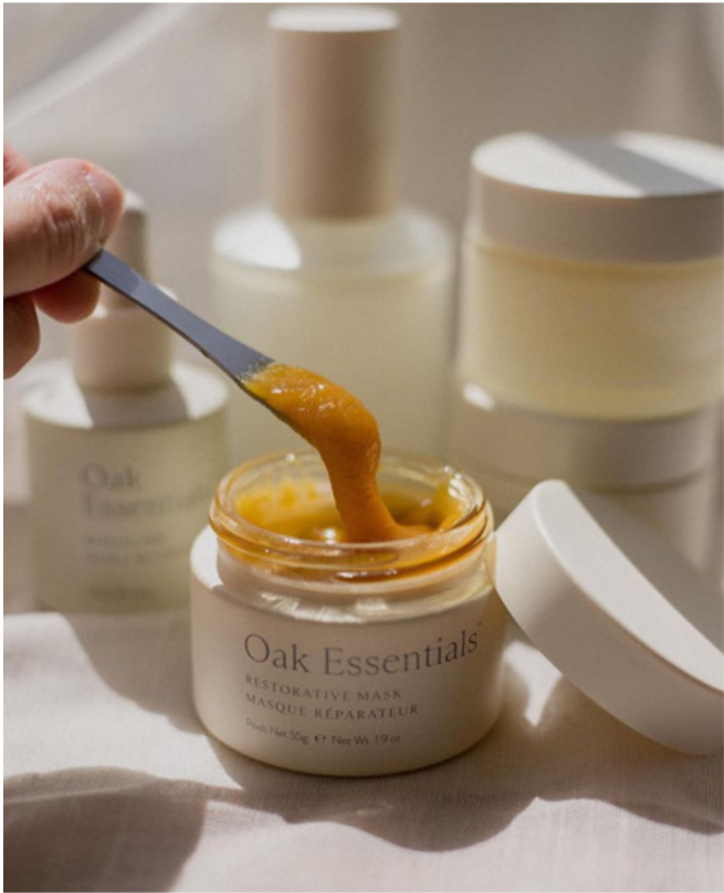
30-40 여성 타겟층의 안정적인 일상을 전달할 수 있는 차분한 톤과 분위기 연출 절제된 공간 + 자연광 + 과하지 않은 연출