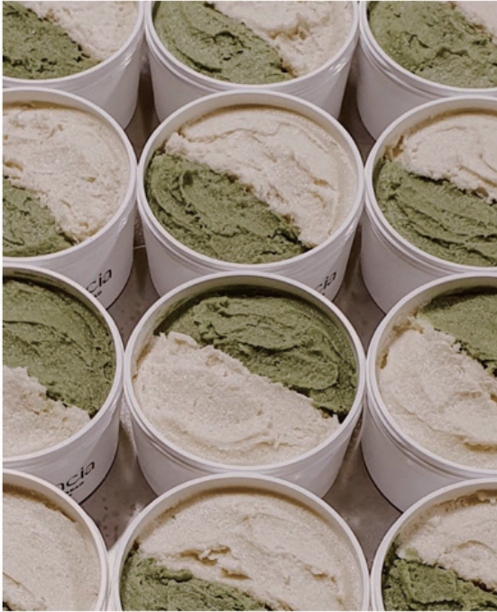
아이스크림 제형이 가득 담긴 이미지 (TEXTURE)