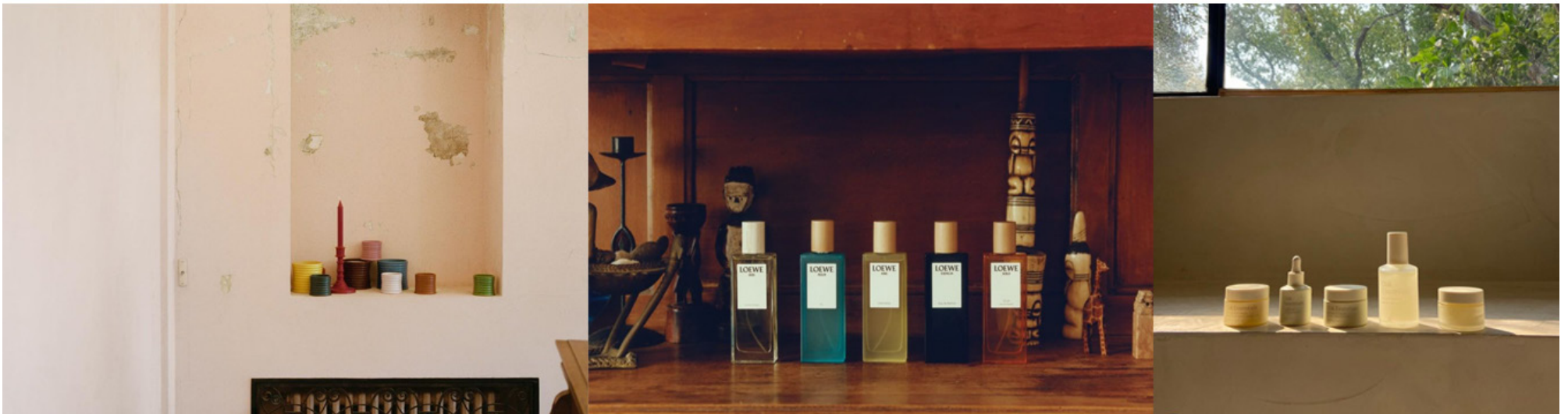
스튜디오 230 공간 활용 + 네추럴한 무드