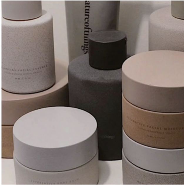
Tone and mood : 화이트 (쿨톤 무드)