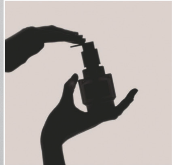
원료를 쌓아 제품과 함께 어울리는 표현