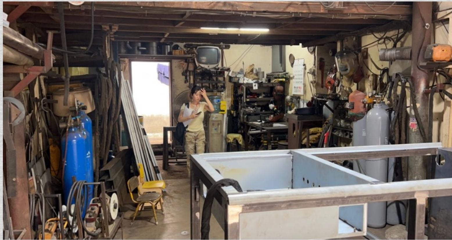
Cadrago Jul 27, 2023 3:24:21 PM