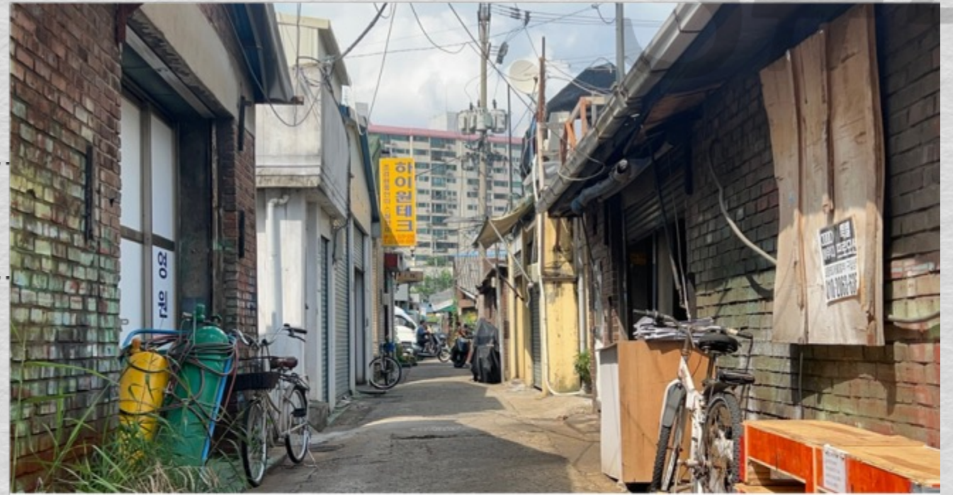
Cadrago Jul 27, 2023 3:01:40 PM RED Komodo | 6K 17:9 | 17:9 35mm Samyang / Rokinon XEEN CF | H: 42.2° V: 23° D: 47.2° TILT 5° NE 46°