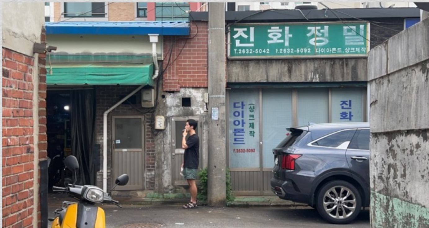
Cadrago Jul 27, 2023 3:32:06 PM RED Komodo | 6K 17:9 | 17:9 35mm Samyang / Rokinon XEEN CF | H: 42.2° V: 23° D: 47.2° TILT 1° SW 216°