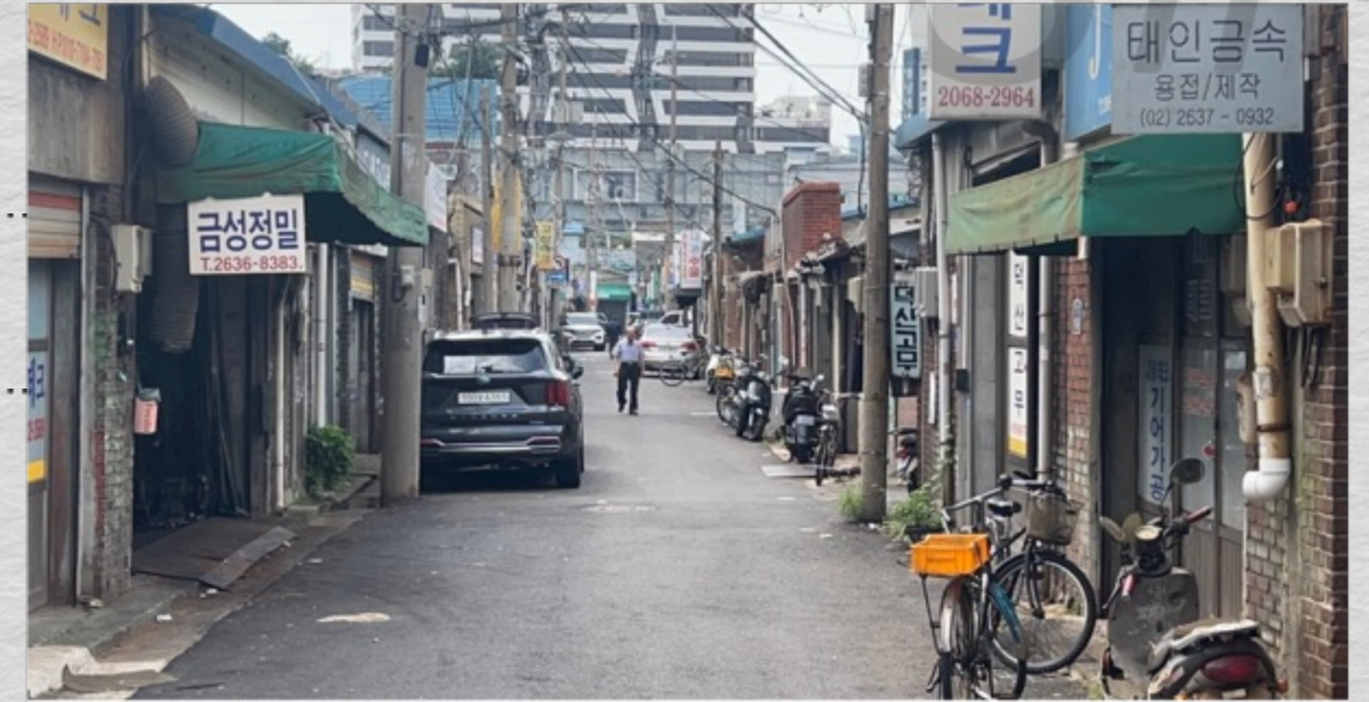
Cadrago Jul 27, 2023 3:29:27 PM RED Komodo | 6K 17:9 | 17:9 50mm Samyang / Rokinin XEEN CF | H: 30.3° V: 16.2° D: 34° TILT -2° W 292°