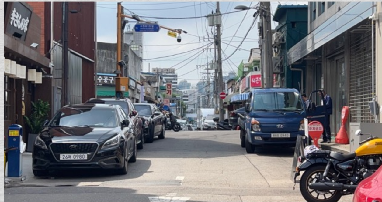
Cadrago Jul 27, 2023 2:41:29 PM RED Komodo | 6K 17:9 | 17:9 50mm Samyang / Rokinin XEEN CF | H: 30.3° V: 16.2° D: 34° TILT 0° NW 302°