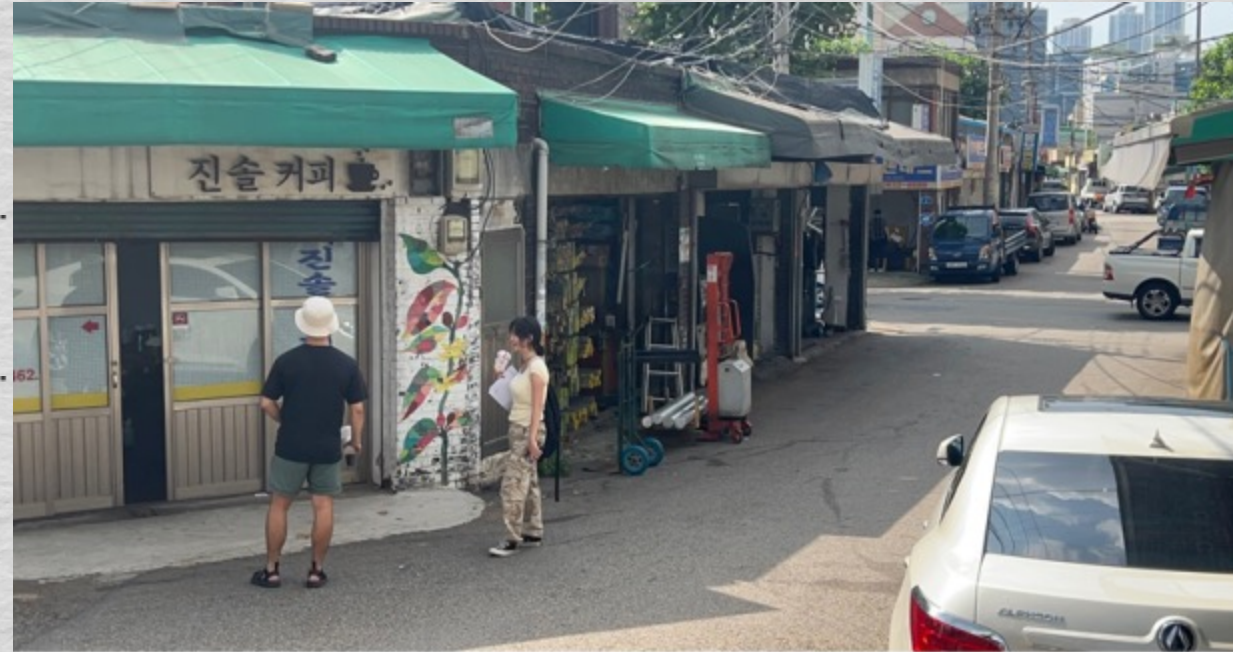
Cadrago Jul 27, 2023 3:43:57 PM RED Komodo | 6K 17:9 | 17:9 35mm Samyang / Rokinin XEEN CF | H: 42.2° V: 23° D: 47.2° TILT -10° NW 302°