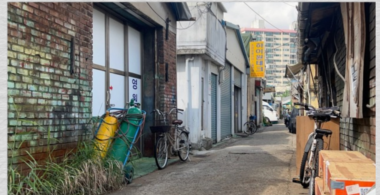
Cadrago Jul 27, 2023 3:01:53 PM RED Komodo | 6K 17:9 | 17:9 35mm Samyang / Rokinin XEEN CF | H: 42.2° V: 23° D: 47.2° TILT 2° NE 29°