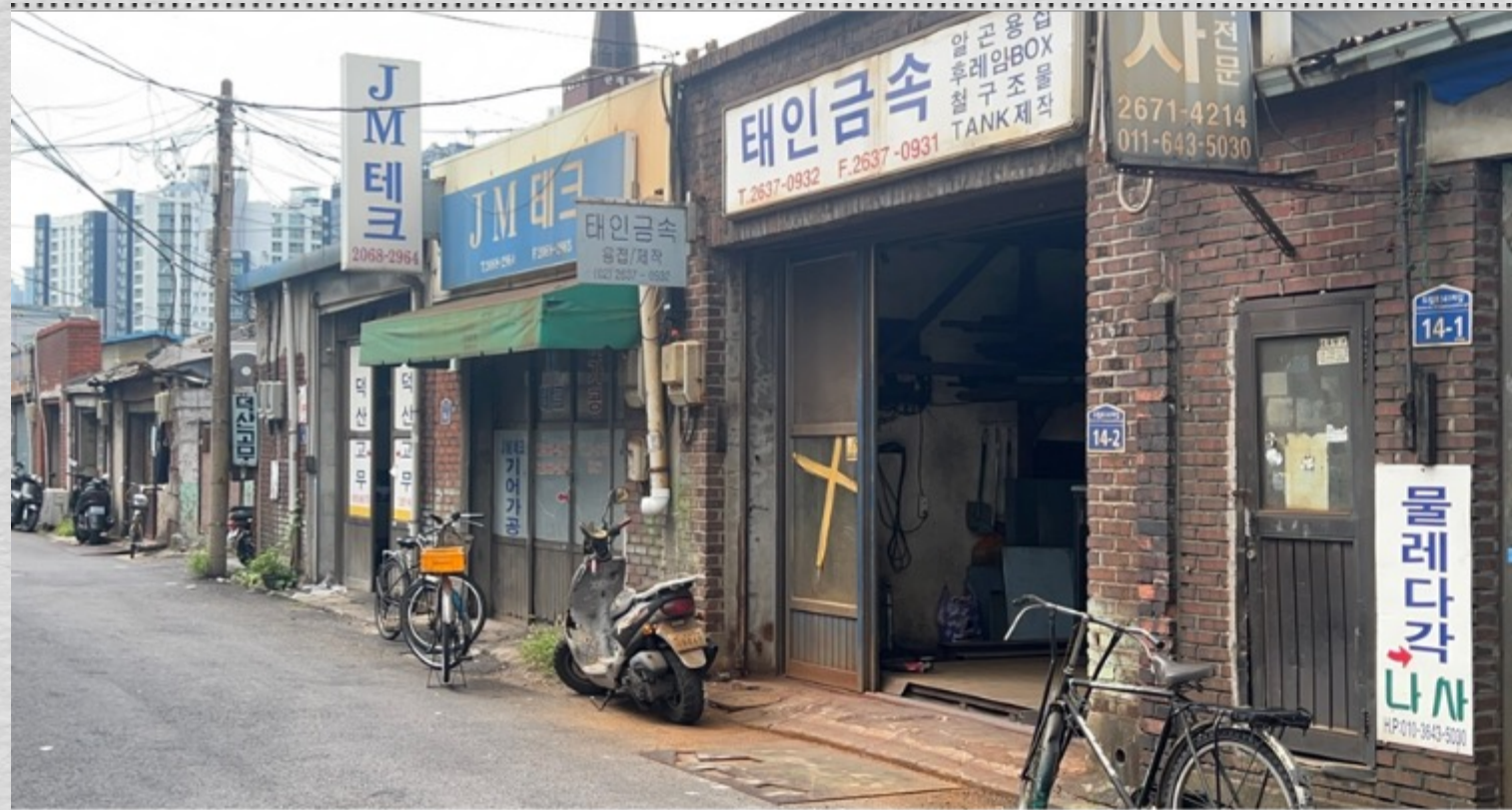
Cadrago Jul 27, 2023 3:29:15 PM RED Komodo | 6K 17:9 | 17:9 35mm TILT 2° NW 334°