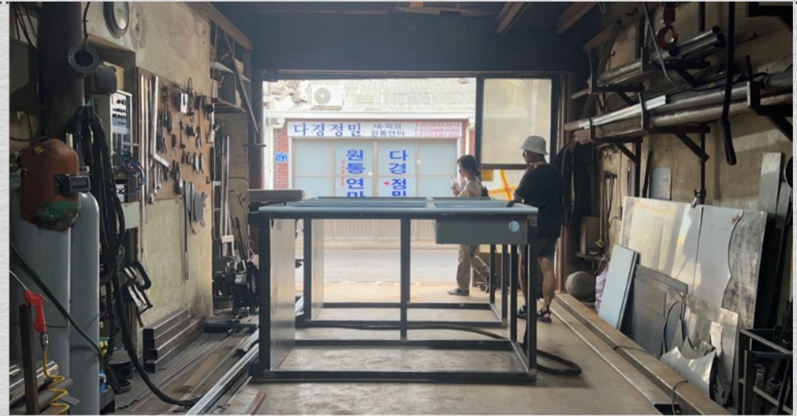
Cadrago Jul 27, 2023 3:27:43 PM RED Komodo | 6K 17:9 | 17:9 24mm TILT -4° S 197°

실제 문래동에 위치한 용접공장 '태인금속' → 1차 컨택 완료 (서울특별시 영등포구 도림로141라길 14-2)