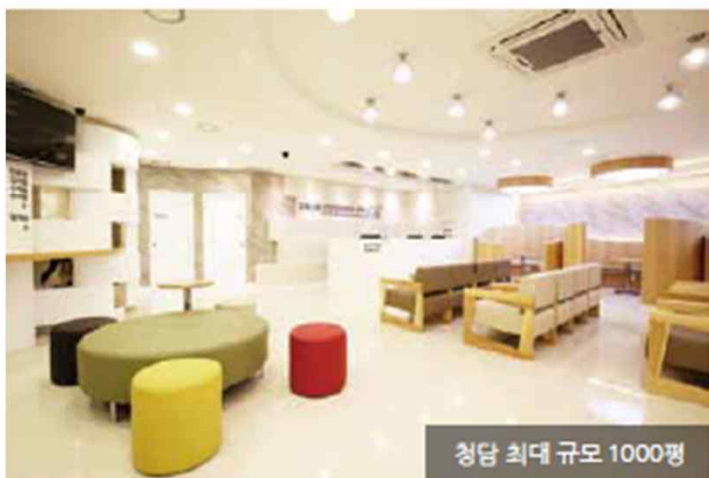
청담 최대 규모 1000평