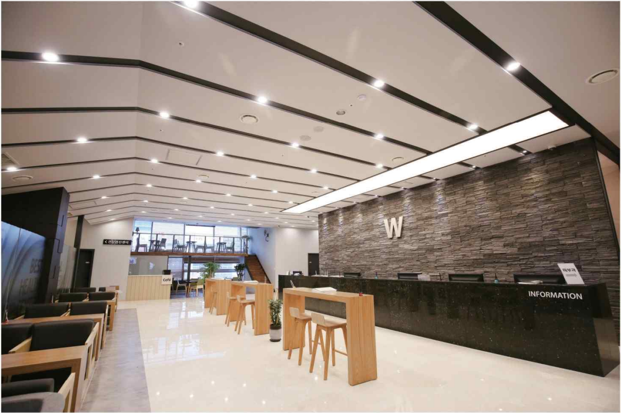
INTERIOR 지역 최대규모 · 편리한 공간설계 최고급 호텔식 인테리어로 더욱 특별한 서비스를 받아보세요.