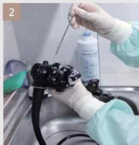
2 세정2 (내부슬질)