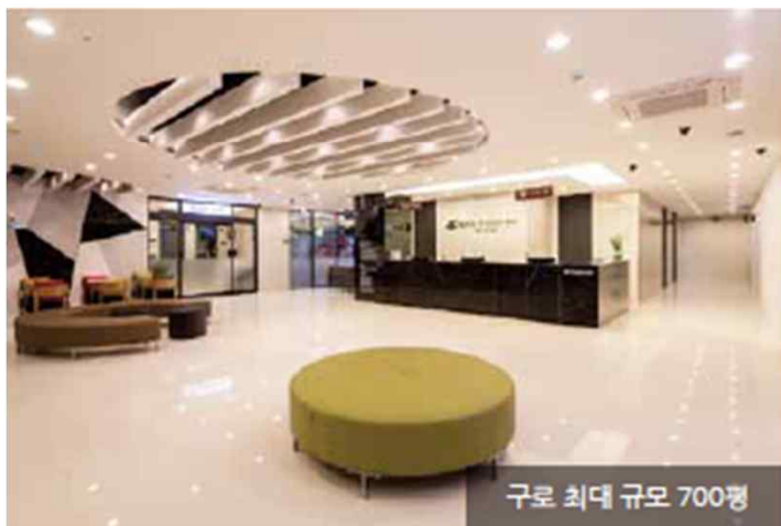
구로 최대 규모 700평