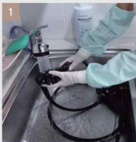
1 세정1 (효소제)