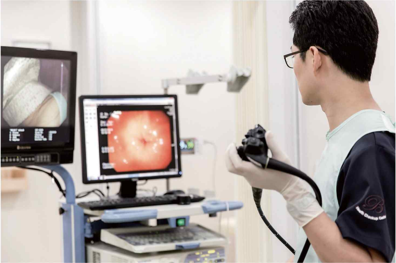
내시경센터 내시경을 시술하는 전 의료진은 소화기내과 전문의로 구성 되어있습니다. ※ 당일 조직검사 및 용종절제술 실시