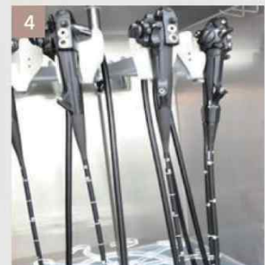
4 보관 (내시경 건조장)