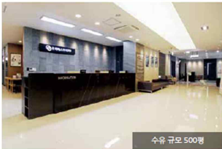
수유 규모 500평