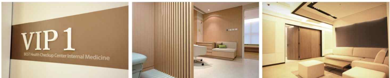
VIP Room 소중한 분들을 위한 특별한 공간, 호텔식 VIP 1인실에서 고품격의 의전 서비스를 제공합니다.