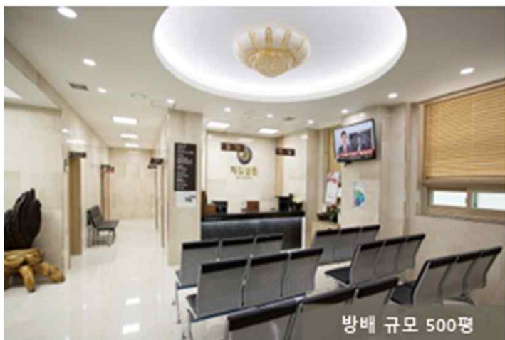
방배 규모 500평