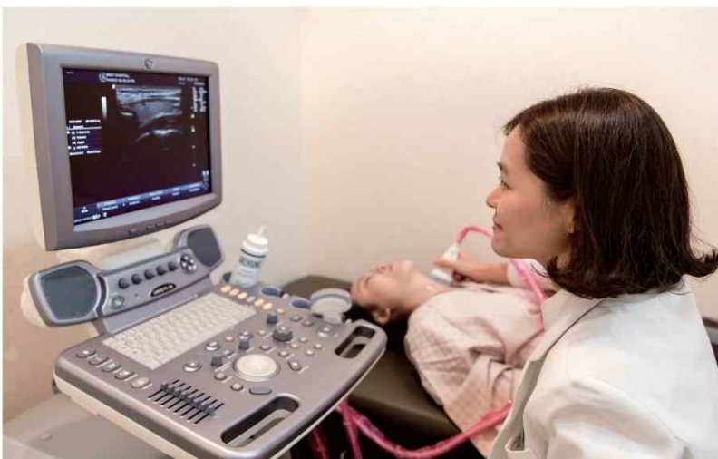
초음파센터 대학병원급 고성능 초음파를 도입 영상의학전문가가 직접 판독