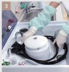
3 소독, 행굼, 건조 (자동세척기)