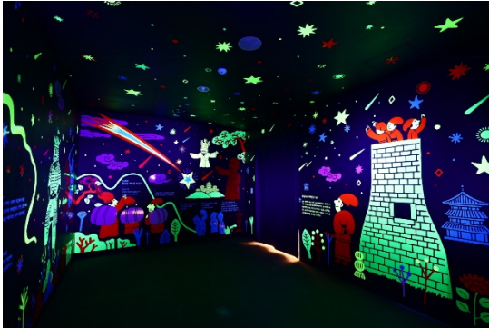
#4 신라에 꽃핀 예술과 과학

[체험활동 목록] 신라의 별 이야기 아름다운 성덕대왕신종 소리를 선으로 표현해요