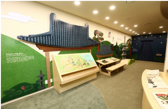
#3 부처님의 나라를 꿈꾸다

[체험활동 목록] 용이 나온 절, 황룡사 탑 속에는 무엇이 들어있을까요? 어떤 절과 탑이 있었을까요? 여러 부처님을 만나요 체험활동하는 아이들과 캐릭터 SK