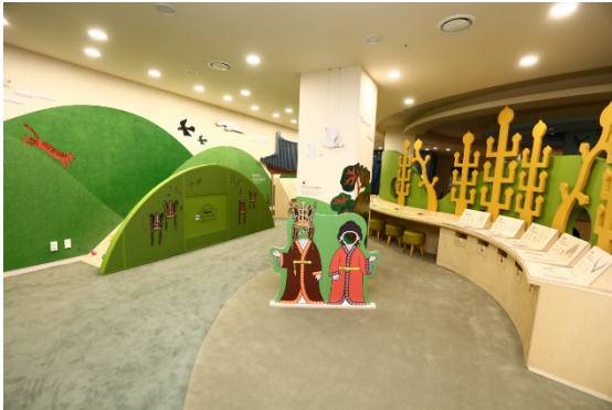
#2 왕을 만나다

[체험활동 목록] 신라왕을 만나요 나만의 황금 문화재를 만들어요 왕의 무덤 안은 어떤 모습일까요? 신라의 왕은 어떤 모습이었을까요? 월지를 만들어요 - 나무블록 체험활동 하는 아이들과 캐릭터 SK