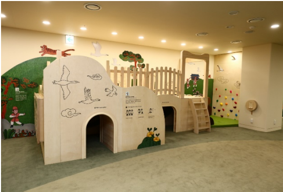
#1 화랑이 되다

[체험활동 목록] 화랑이 궁금해요 - 질문 세속오계를 실천해요 - 교훈 몸과 마음을 수련해요 (활쏘기 연습)