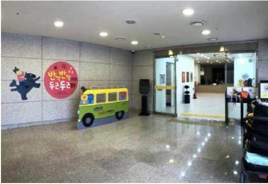
# 전시장 입구 (내부)