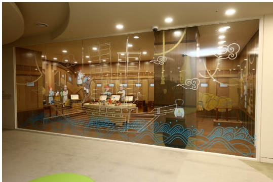
#5 실크로드, 그림자 극장

- 신라는 머나먼 서쪽 나라 사람들과 어떤 물건을 주고받았을까? - 보물 목걸이 걸치는 토랑 CU [토랑] 공주 같아? [이랑] ㄴ ㄴ