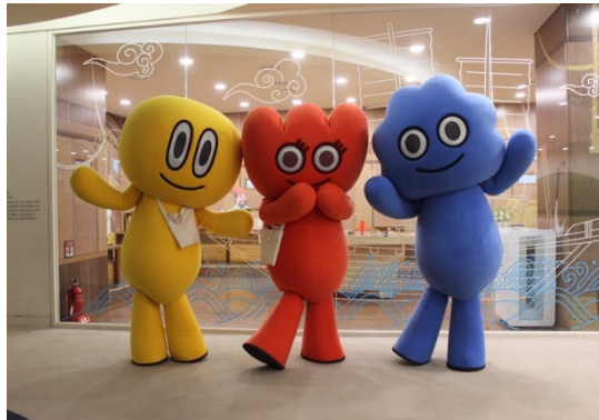
# 전시장 입구 (내부)