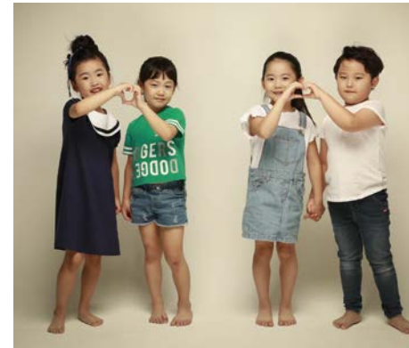
어린이 출연자 4명